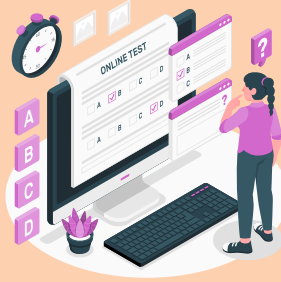
Online Test Series & Quiz